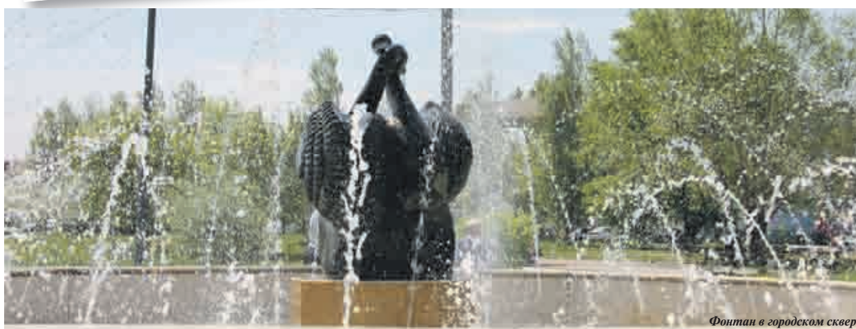
Фонтан в городском сквере