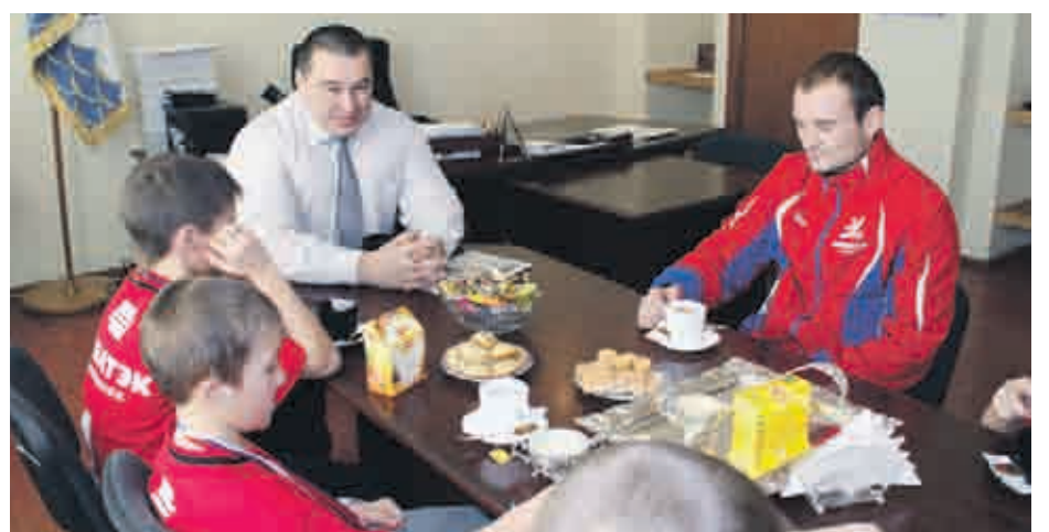
Спортсмены на приеме у Главы района