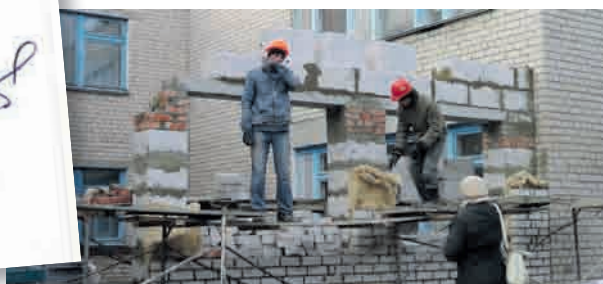
Пристрой к детскому саду