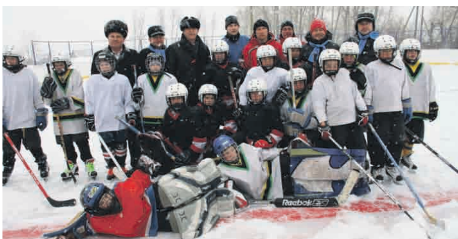
Открытие нового хоккейного корта