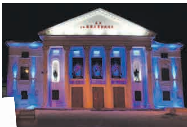
ДК Ленина, п. Красногорский