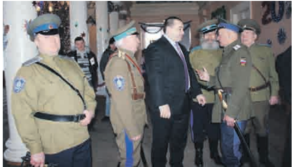
Встреча с казаками

Свою историю помним и чтим, в почете ветераны труда, особенно шахтеры, бережно и трепетно относимся к фронтовикам. Гостям города советуем посетить историко-краевед-