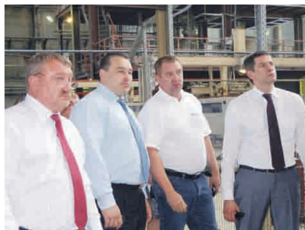
Рабочий визит на завод автоклавного газобетона «ИНСИ-Блок»

Объем продукции, произведенной крупными и средними предприятиями за 2013 год, по сравнению с 2012-м, составил 106,8 процентов.